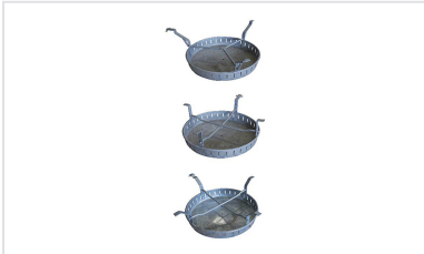
Seau à boue pour regards PAMREX