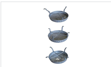
Seau à boue pour regards PAMREX