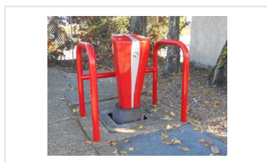
Barrière de protection pour poteaux d'incendie - Modèle ETRIER 4P