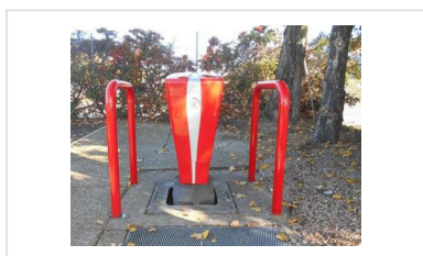
Barrière de protection pour poteaux d'incendie - Modèle EPINGLE