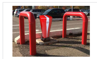
Barrière de protection pour poteaux d'incendie - Modèle EPINGLE POIDS LOURD