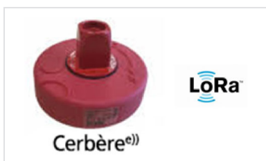
Capteur multifonction CERBERE