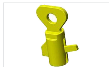
Clés de manoeuvre SCS