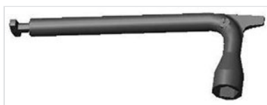
Clés de manoeuvre PENTA