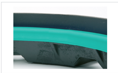
Anel em EVA