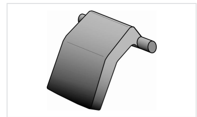
Patilha anti-roubo para tampa KORUM, KOREX e BELSYS 600