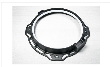
Anel em Polietileno