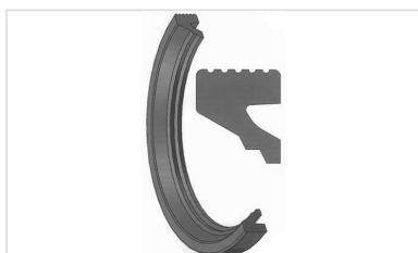
Junta IM para acessórios gravíticos