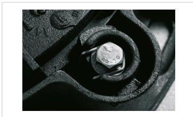
Tampas PAMETANCHE - Clips Anti-rotação