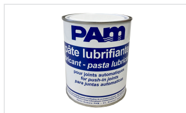
Pasta lubrificante - Gamas NATURAL, INTEGRAL e PLUVIAL