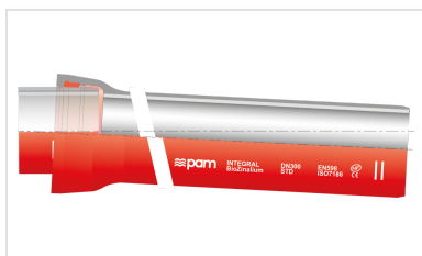
Conjunto Tubo INTEGRAL Standard + Junta Standard