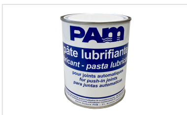
Pasta lubrificante - Gamas NATURAL, INTEGRAL e PLUVIAL