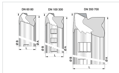
junta STD Vi para Tubos e acessórios DN60-700