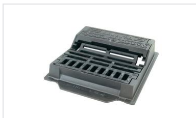
Sumidores SELECTA 500 e MAXI C250 - Instalação