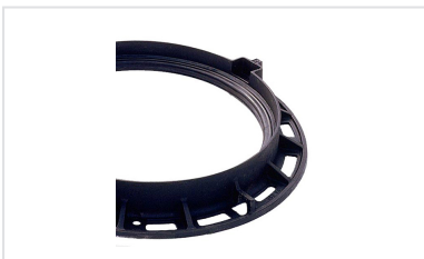
Junta em elastômero