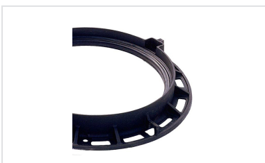
Junta em elastómero