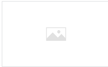
Schachtabdeckungen AKSESS Einmörtelung