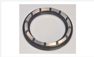
Dichtung IZIFIT Vi