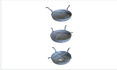
Cubo de lodos para Registros PAMREX