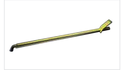
Accesorios para registros : Llave de maniobra C24 para PAMREX, VIATOP y VIATOP 2