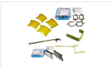
Galgas de montaje y desmontaje de juntas Universal Ve