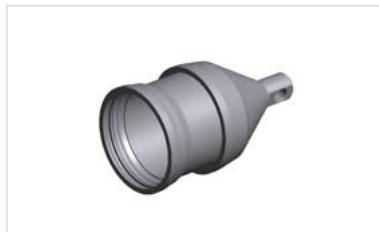
Cabeza de tiro para Tuberías DIREXIONAL Universal Ve