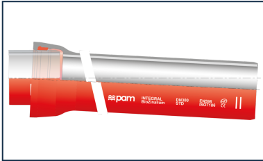
Kit Tubería Standard INTEGRAL + Junta Standard