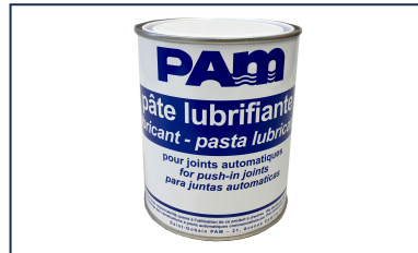
Pasta lubricante - Gamas NATURAL, INTEGRAL, y PLUVIAL