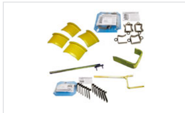
Galgas de montaje y desmontaje de juntas Universal Ve