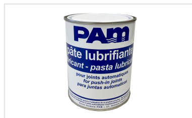
Pasta lubricante - Gamas NATURAL, INTEGRAL, y PLUVIAL