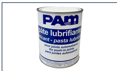
Pasta lubricante - Gamas NATURAL, INTEGRAL, y PLUVIAL