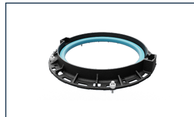
Solution de scellement rapide et durable INSTALL Plus pour PAMREX