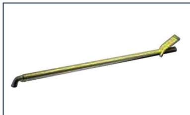
Accessoires pour regards : Outil de manoeuvre C24 pour regards PAMREX, VIATOP et VIATOP 2