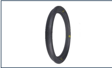
Bague de joint Standard Gravitaire (STD G) pour tuyaux et raccords BIOGAN® DN150-200