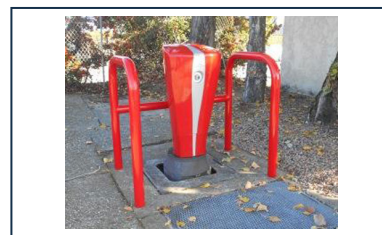
Barrière de protection pour poteaux d'incendie - Modèle ETRIER 4P