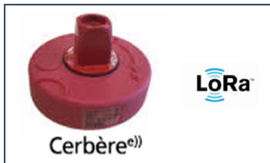
Capteur multifonction CERBERE