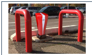
Barrière de protection pour poteaux d'incendie - Modèle EPINGLE POIDS LOURD