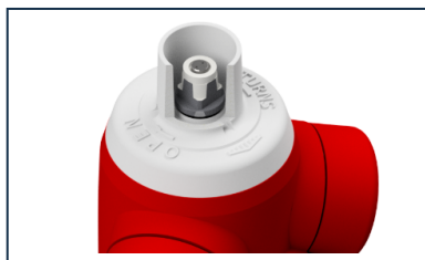
Kit Anti Street Pooling pour Poteau d'incendie ATLAS+ et C9+