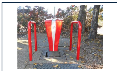
Barrière de protection pour poteaux d'incendie - Modèle EPINGLE