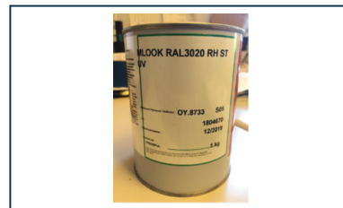
Notice - Retouche peinture Poteau Incendie