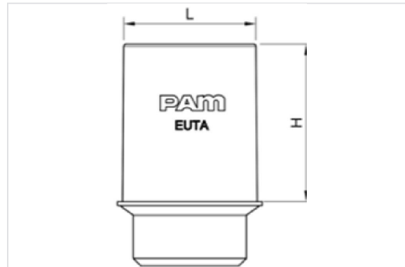
Pour robinet NEXUS Universel