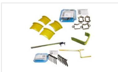
Cales de montage et de démontage pour jonctions Universal Ve