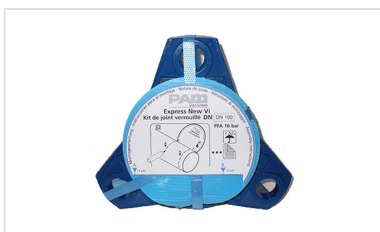
Kit EXP New Vi pour Tuyaux et Raccords EXP DN60-250