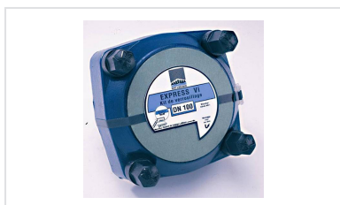
Kit EXP Vi pour Tuyaux et Raccords EXP DN300