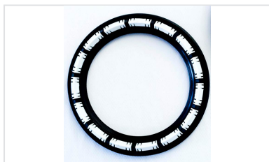
Bague de joint IZIFIT