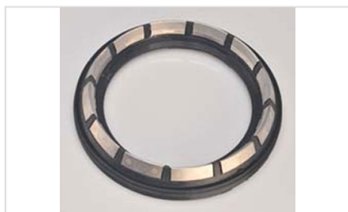
Bague de joint IZIFIT Vi