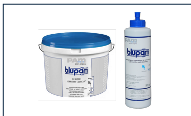
Pâte lubrifiante BLUPAM