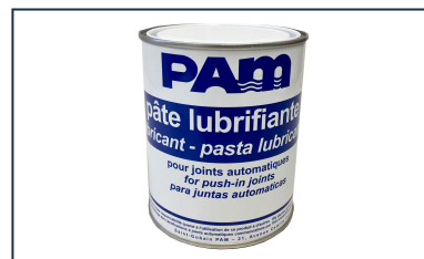
Pâte lubrifiante - Gammes NATURAL, INTEGRAL, et PLUVIAL