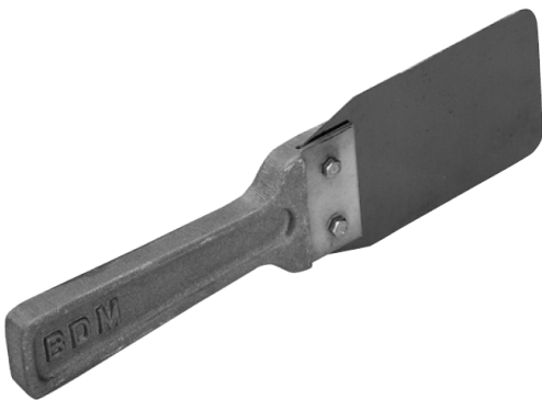
Lamina di intercettazione per Artiglio P.C.