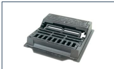
Sumidores SELECTA 500 e MAXI C250 - Instalação