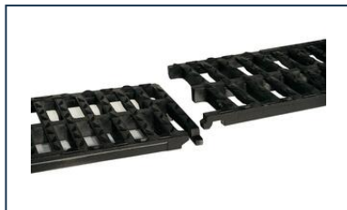
Grelha AUTOLINEA D400 - Dimensões das sarjetas em betão