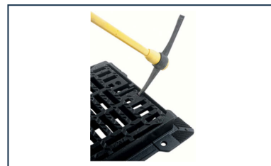
Manual de instalação - Desmontagem e remontagem da grelha DEDRA 600, classe de carga D400