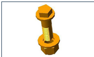
Fecho ¼ de volta