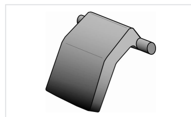
Patilha anti-roubo para tampa KORUM, KOREX e BELSYS 600