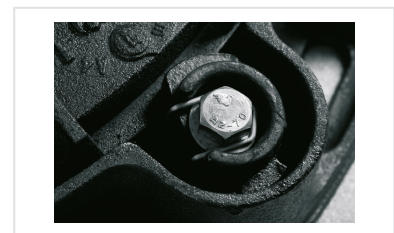
Tampas PAMETANCHE - Clips Anti-rotação