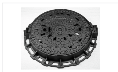
Cavilhas anti-roubo para PAMREX / VIATOP 600 e 700 / VIATOP 2