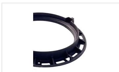
Junta em elastómero