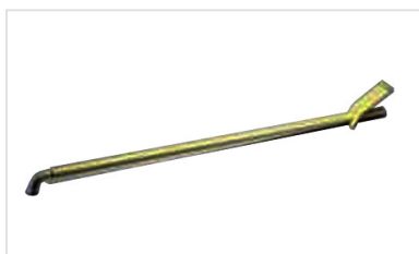
Acessórios para Tampas: Chave de manobra C24 para tampas PAMREX, VIATOP e VIATOP 2